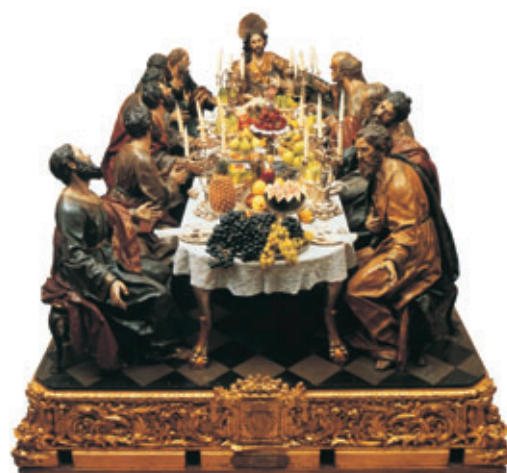
El escultor Francisco Salzillo se cuenta entre los artistas más destacados del siglo XVIII español, como autor de magníficas obras religiosas y pasos de Semana Santa.